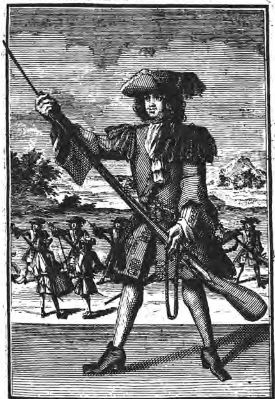
Haut la Bayonnette